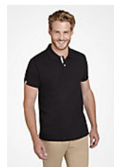
SOL'S PORTLAND MEN 00574